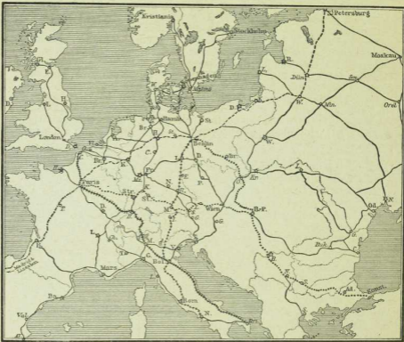
104. Die wichtigsten internationalen Bahnlinsen Europas.