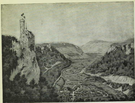
Abb. 1, § 35. Das Schaf-Tal im Schwäbischen Jura und Schloß Lichtenstein. Blick nordwärts, nach Reutlingen zu.