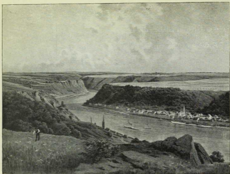
Abb. 1, § 43. Rheinlandschaft bei St. Goar.

(Nach einem Schulwandbilde des Gölzischen Verlags in Wien.)