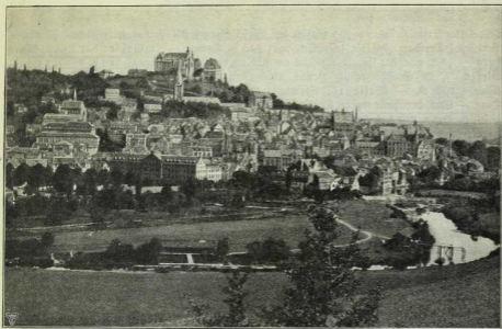
Abb. 1, § 46. Marburg an der Lahn.

Vorne die nach links fließende Lahn. Dahinter die Stadt, malerisch an den Abhang des Berges hingeschmiegt, der ein mächtiges Schloß trägt. Unterhalb des Schloßes die Elisabethkirche („Die Rosen der heiligen Elisabeth!“). Im Schlosse fand 1529 das Religionsgespräch zwischen Luther und Zwingli statt.