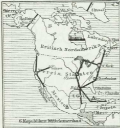
Abb. 1, § 213. Nordamerika. (1 Maß = 1000 km)

Zur Wiederholung früher erworbener Kenntnisse: