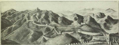
Abb. 1, § 263. Die chinesische Mauer (auf der Höhe des Nankou-Paizes, südwestlich von Peking).