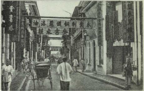
Abb. 4, § 264. Chinesische Geschäftsstraße in Shanghai.