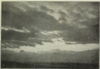
62. Stratuswolken, die ausgedehnten, zusammenhängenden Schichtwolken, bilden den dritten Haupttypus der Wolkenformen. Sind sie zwar ausgedehnt, deutlich geschichtet, aber hier und da durchbrochen und zu Wolfenballen geformt, so entstehen die Strato-Rumuluswolken wie auf dem Bilde. Gewöhnlich säumen die Schichtwolken den Horizont, bilden jedoch auch höher am Himmel einen grauen Wolfenschleier.