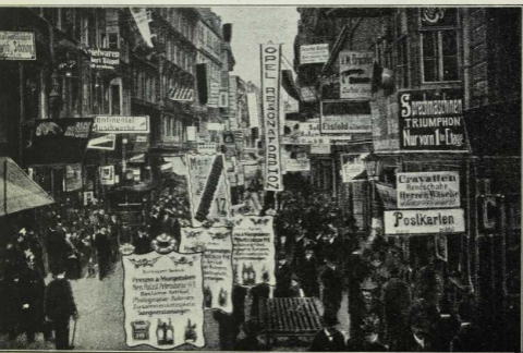
Abb. 49. Die Petersstraße in Leipzig während der Messe.

gang zu verteidigen (1631). An der Elbe aufwärts liegen Zorgau und Wittenberg , letzteres Lutherstadt und Ausgangspunkt der Reformation in Deutschland. Den Norden der Provinz bildet die Altmark, die Wiege des brandenburgisch-preussischen Staates. Sie ist ein unfruchtbarer, dünnbevölkerter Landstrich, der keine größeren Städte aufzuweisen hat. Im Saaletal ist eine Reihe volkreicher Städte emporgeblüht: