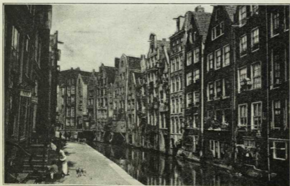
Abb. 62. Hamburger Fleet.

3. Hamburg , 932000 Einw., hat eine günstige Lage. Obwohl es 135 km von der Küste entfernt ist, machen sich Ebbe und Flut hier noch geltend. Selbst