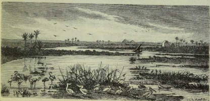
Fig. 30. Mündungsdelta des Nils. (Im Vordergrunde Flamingos und Pelikane.)