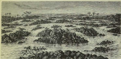
Fig. 28. Oberlauf des Nils mit Stromschnellen (Katarakten).