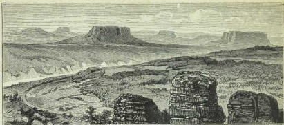
Fig. 26. Das Elb-Sandsteingebirge von der Gasse aus gesehen S. S. 45.