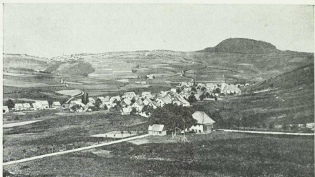
Das Erzgebirge, ein Massengebirge wie der Harz.

Es hat ausgebreitete, meist bewachte Hochflächen und zahlreiche bewaldeteuppen. Auf der Höhe Altenberg (728 m), im Tale Geising (599 m), rechts die Bajalstufe des Geising (824 m).