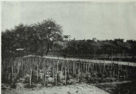
Südlicher Lanbrücken bei Grünberg in Schlesien. Höhe des Ortes 120 m, der Hügelkränze bis 200 m. Nördliches Weinbaugebiet in Deutschland. Im Vordergrunde Nebengärten. Der Weinbau wird hier durch die hohe Sommertemperatur ermöglicht; gegen die Winterkälte bedürfen die Rebhölzer sorgfältigen Schutzes. Die Trauben werden hauptsächlich zur Likörbereitung verwendet.