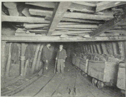
1. Im Steinkohlenbergwerk.