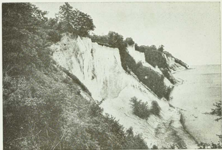
Kreideklüfte von Stubbenhamer bei Zahny auf der Insel Rügen. Höhe der Steilklüfte 80 m. Aus den grünen Nereidswellen und den dunklen Felsenwäldern heben sich die schneeweißen Kreidewände der Insel malerisch hervor, ein prächtiges Seitenstud zur Insel Helgoland.