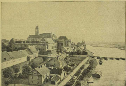
57. Blick auf das Schloß Marienburg und das niedrige Ufer der Rega. Die anmutigen Uferlandschaften finden sich im Gegenjah zu anderen Flüssen bei der Ober und der Weichsel im Unterlaufe, wo die Flüsse die Seenplatten durchbrechen. Am hohen Weichselufer, wo malerische Städte und Festen des Deutschen Ritterordens stolze Erinnerungen wecken, ist keine Stätte herrlicher als die Marienburg, die, im alten Glanze wiederhergestellt, weit über das sache, teilweise kumpfige Ufergelände hinausragt.