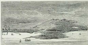
Fig. 6. Bild einer Küstenlandschaft mit Fluß usw.

Bei noch stärkerer Verkleinerung als in Fig. 4 und 5 ist es aber nicht mehr möglich, auch nur die wichtigeren Einzelheiten anzugeben. Die einzelnen Gebäude und die kleineren Straßen verschwinden,