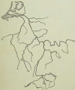
15. Stromgebiet des Rheins.