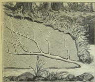
13. Quelle, durch filterndes Wasser gebildet.