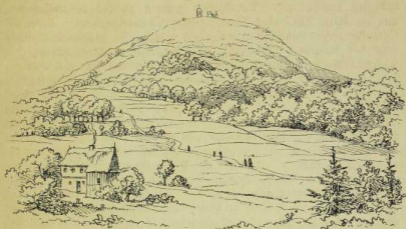
Die Lausche (Kegelform.)