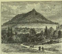
3. Die Landeskronen bei Görlitz.