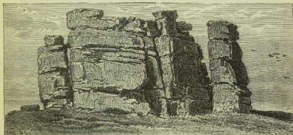
4. Die Mittagssteine auf dem Kamm des Riesengebirges.