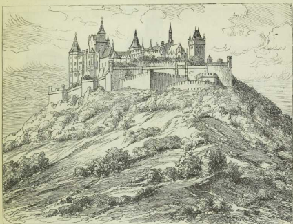
1. Die Burg Hohenzollern, in ihrer jetzigen Gestalt.