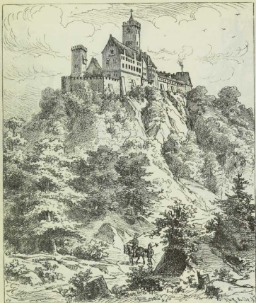
5. Die Wartburg bei Eisenach.