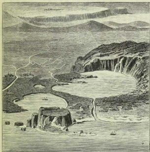
Fig. 6. Bild aus der Vogelschau.