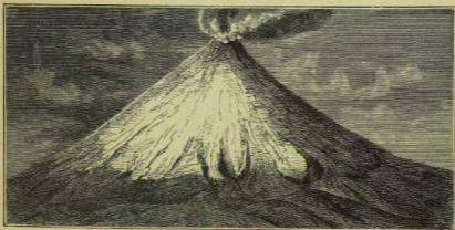
10. Vulkan Cotopaxi.