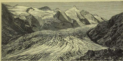
8. Gletscher: Paßerze am Großglockner.