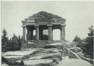
Gipfel des Donon mit Hauptkonglomerat.