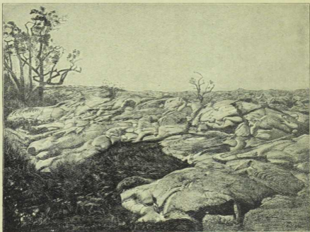
Abb. 6, § 283. Über bebautes Feld geflossener Lavaström des Kilauea, Hawaii.