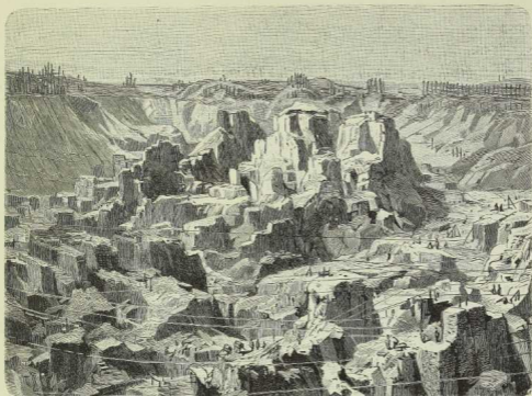
frühere Beschaffenheit der Diamantengruben von Kimberley. (Nach Photographie.)