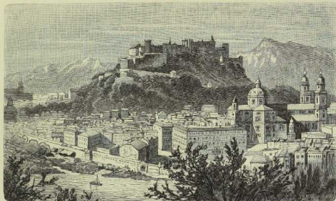
Salzburg und das Tännengebirge. (Nach Photographie.)