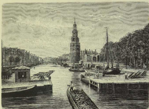
Der Binnenkanal in Amsterdam. (Nach Photographie.)