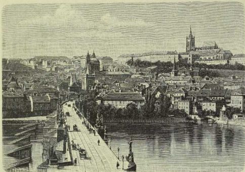
Die Kleinseite von Prag mit dem Hradštin. (Nach Photographie.)