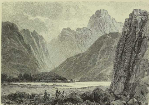
Der Paß Hagia Kumeli im Syhakia-Gebirge, Kreta. (Nach Originalzeichnung.)