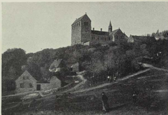
25. Der Gipfel des Petersberges bei Halle a. S.

Als einige Erhebungen unterbrechen die weite Ackerbauebene der sächsischen Tieflandsbucht einige Porphyrgipfel, deren höchster der weithin sichtbare Petersberg nordöstlich von Halle mit seiner Kloster- ruine ist. Verschiedentlich ist die Felsoberfläche dieser Porphyrtuppen von den darüber hinweg- gleitenden Gletschern der Eiszeit geglättet und getrübt worden.