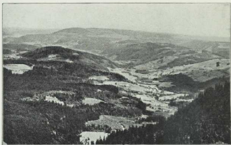
187. Blick vom Feldberg im Schwarzwald ins Bärenthal.

Der Schwarzwald neigt viel stärker zur Hochflächenbildung als der gegenüberliegende, ihm nach Bau und Entfaltung so nahe verwandte Wasgenwald. Daher hat der Ackerbau dem Walde in den mittleren Höhenlagen ziemlich große Flächen abgewonnen, und weite Bergwiesen dienen bis hoch hinauf der Viehzucht, die aber nicht zur Almenwirtschaft geworden ist, wie in den Vogesen.