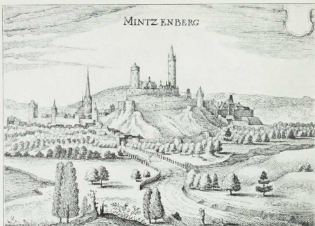
Burg und Stadt Münzenberg um 1605. Nach Merian. (Seite 29.)