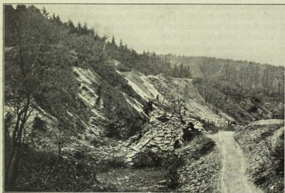
Fig. 67. Steinbruch mit Schichtflächen.