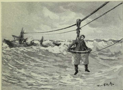
Fig. 27. Rettung durch eine Hofenboje.