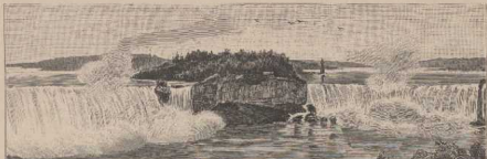
Unio-Sata. Amerikanischer Fall, 25 m hoch. z. Die Niagarafälle, 50 m hoch. Britischer Fall, Canadischer Fall, 50 m hoch. Eigeninsel.