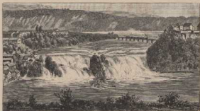
b. Der Rheinfall bei Schaffhausen. Seydlitz B. Schaffhausen. Höhe des Falles 91 m, Breite über 100 m. Schöner Lösser.