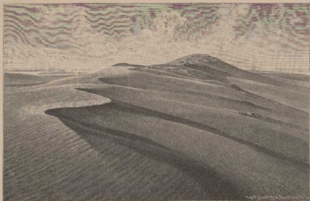
a. Dünen der kufischen Nehrung. Aus Lellis, Landeskunde von Ost- und Westpreußen.