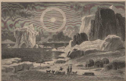
c. Küste im Polargebiet. Seyditz B.

Weitere Küstenbilder vgl. S. 17a. 27c. 29c. d. 31a. 33d. 34a—c. 37d.