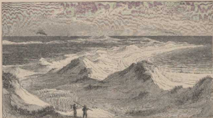
a. Dünen bei Bix auf Rügen. G. R. II, 28. Vgl. S. 16a.