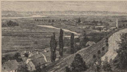
d. Weichsellandschaft in Posen. Aus Tromau, Landeskunde von Posen.