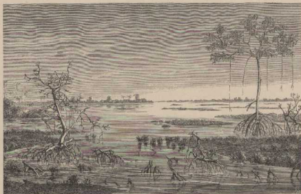
b. Lagune mit Mangroven von der Loangküste. G. B. II, 43.