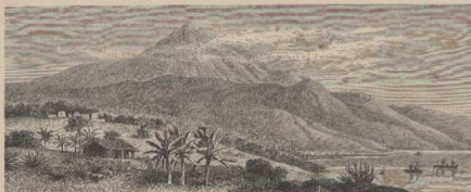
a. Küste von Teueriffa mit dem Pit de Teyho. G. B. II, 43.