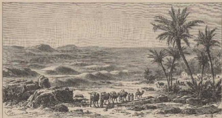
a. Aus der Wüste Sahara (rechts Oase, in der Mitte Dünen). Seydlitz C. Vgl. S. 14f—h.