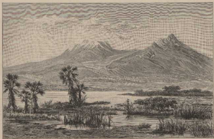
Kibo, 5. 1. der Höhe 1900 m. Mawenzi, 5. 1. der Denke 5050 m. c. Der Kilima-Ndschara. (Nach Dr. Hans Meyer.) Seydlitz B.