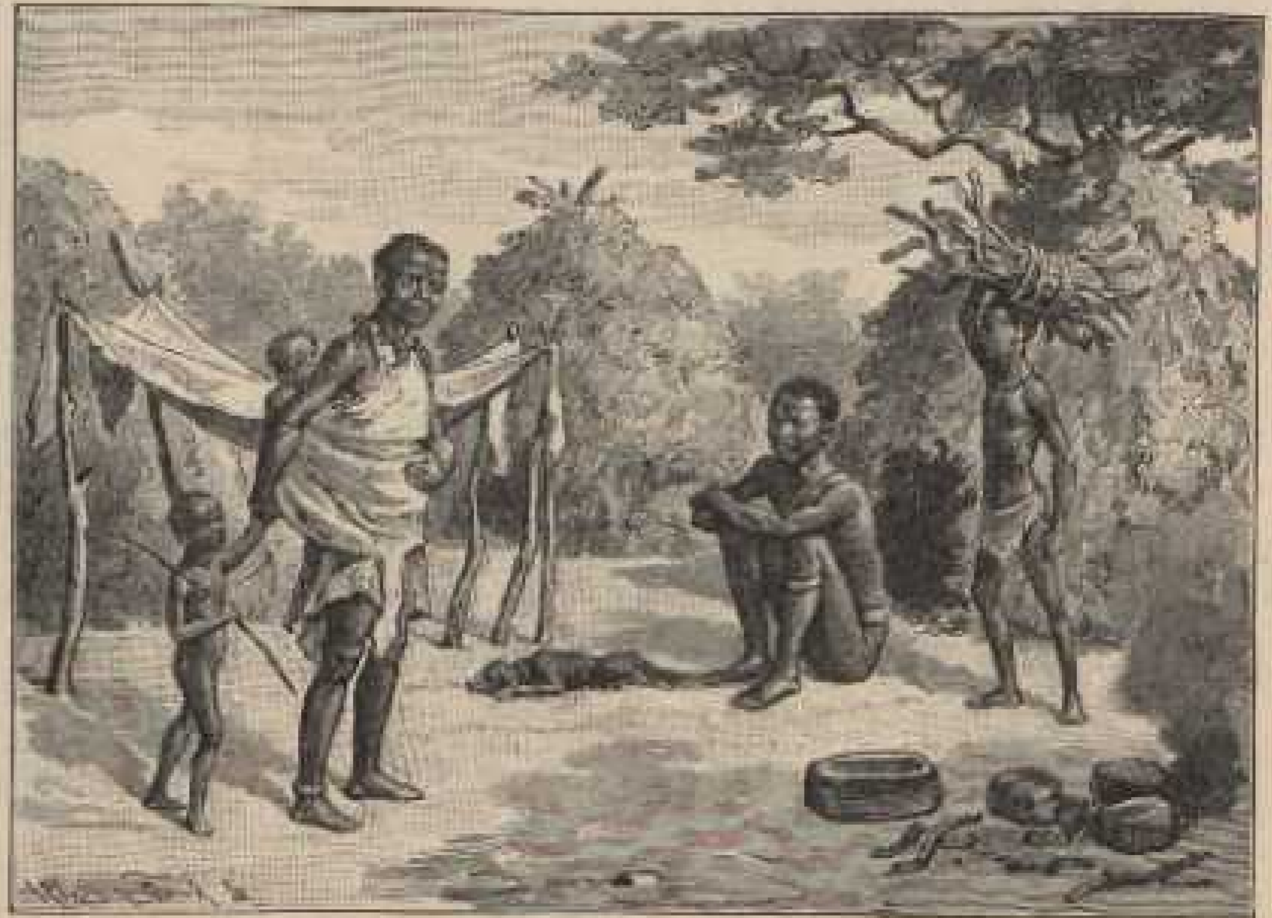
f. Hütten von Buschmännern in der Kalahari. Seydlitz B.