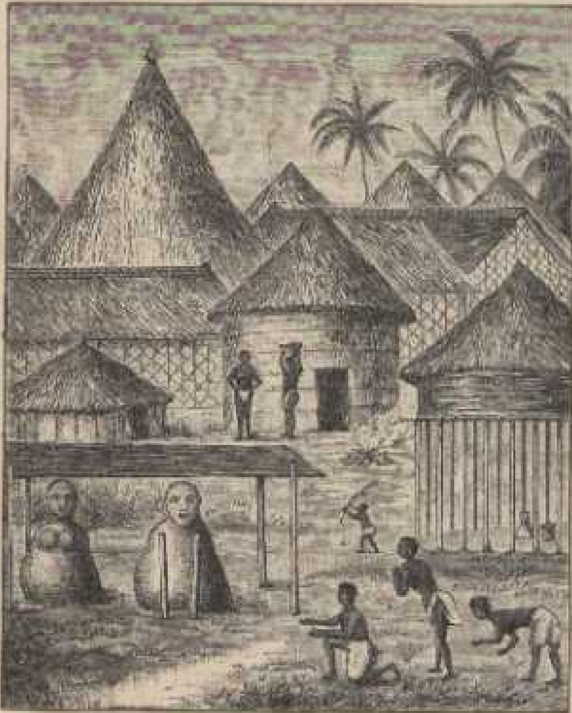
c. Dorf in Central-Afrika. Vorn eine Fetischhütte. G. B. III, 117.