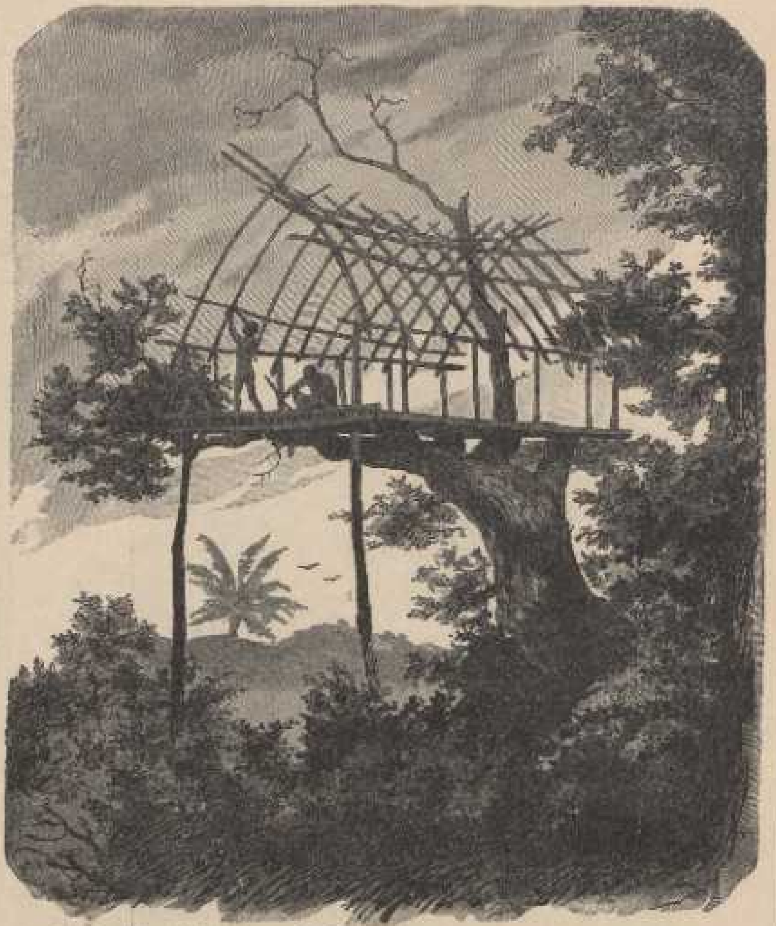
b. Bau eines Baumhauses in Neuguinea. Aus Finsch, Samoafahrten.

Die Pfahlbauten an der Humboldtbai gehören zu den ansehnlichsten Bauwerken ihrer Art. Sie ruhen auf einem soliden Pfahlroste und sind etwa 8 m hoch. Die Dächer bestehen aus Ried oder Gras. Vor den Eingängen der Häuser befinden sich Plattformen, welche ebenfalls auf Pfählen stehen und ungefähr 9 m über die Wasseroberfläche ragen.