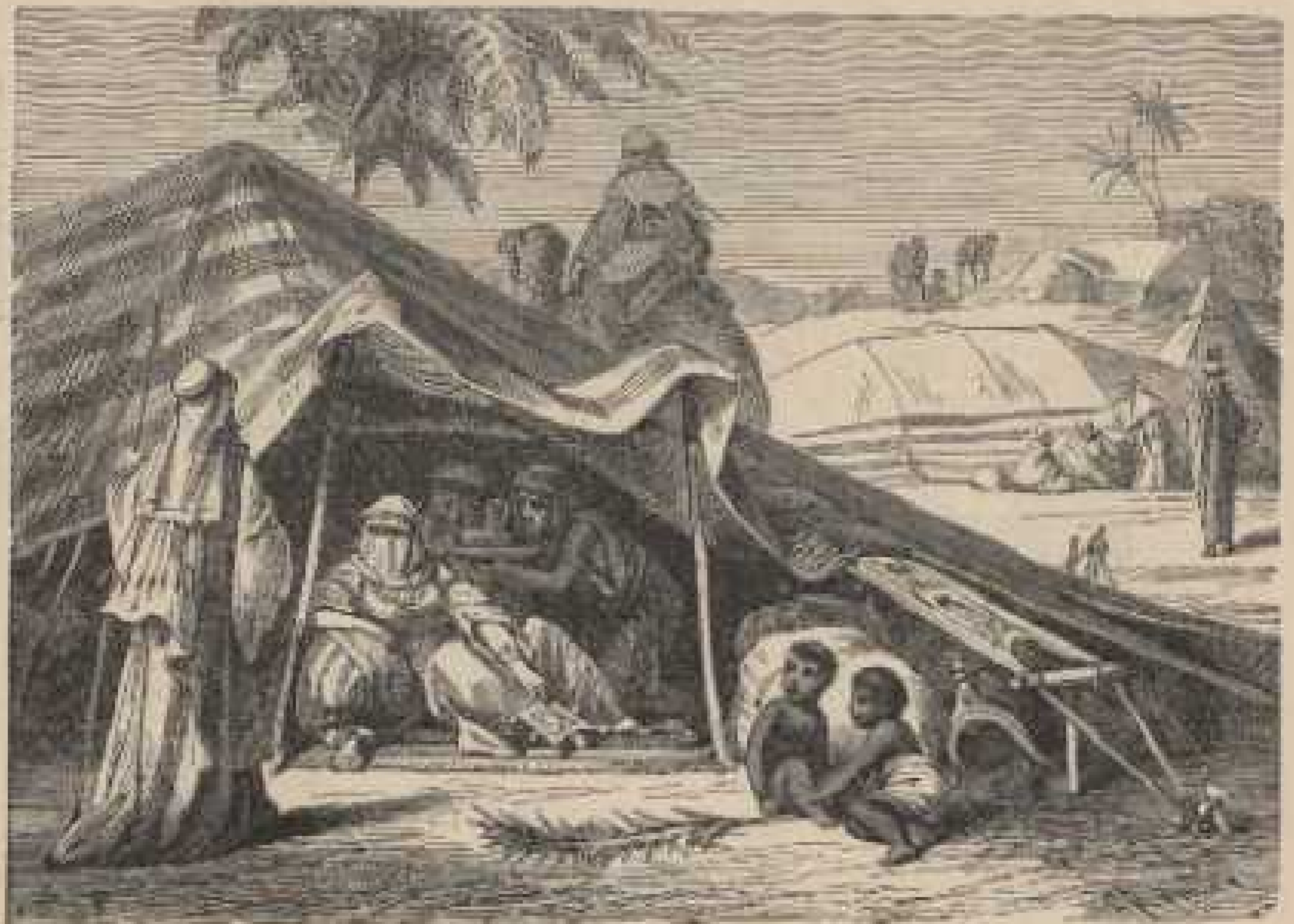
d. Arabisches Zelt. Seydlitz B. Webvorrichtung, Kamelsattel.