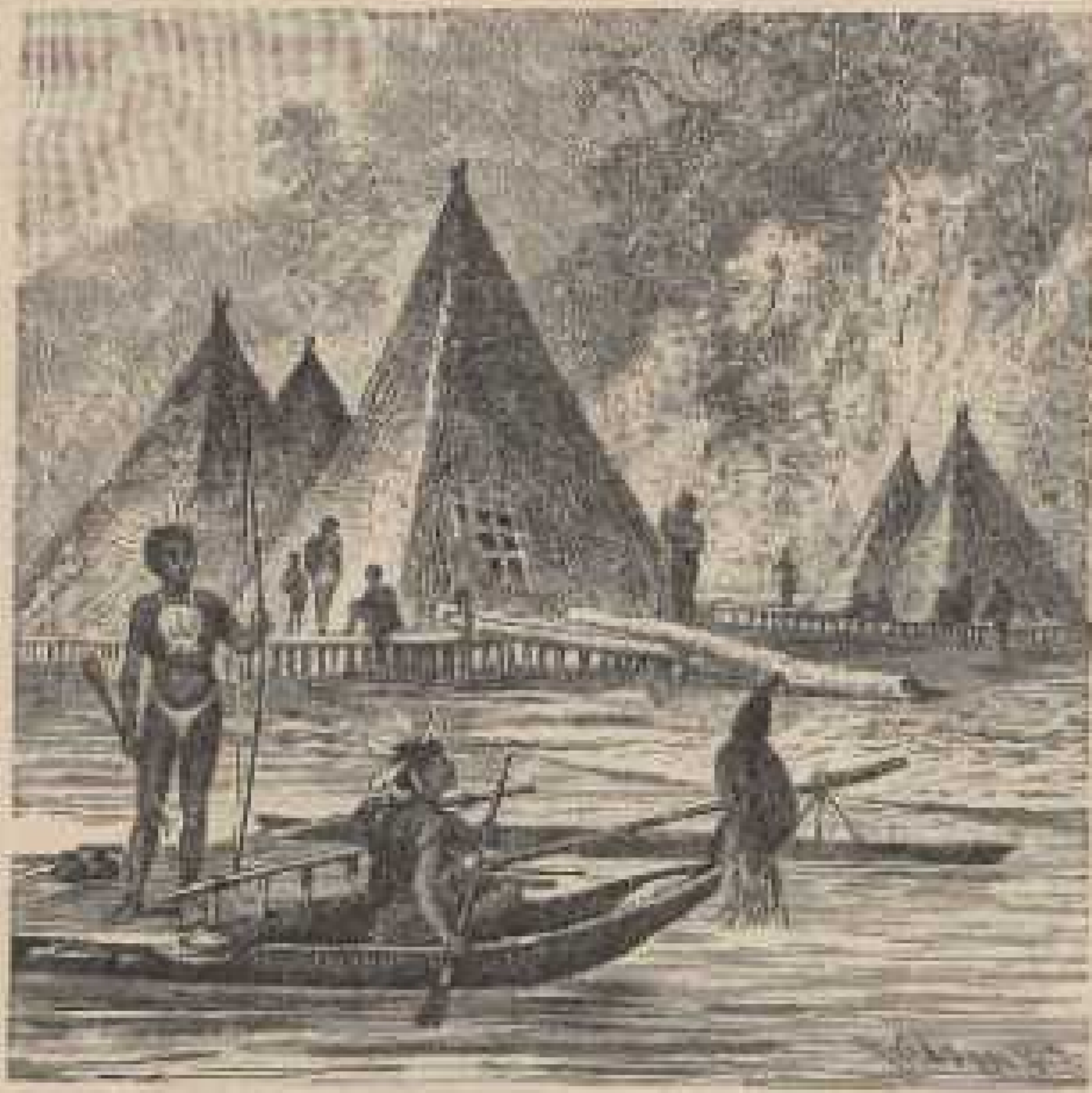
a. Pfahldorf an der Humboldtbai, Nordküste von Neuguinea G. B. III, 108.

Die Pfahlbauten an der Humboldtbai gehören zu den ansehnlichsten Bauwerken ihrer Art. Sie ruhen auf einem soliden Pfahlroste und sind etwa 8 m hoch. Die Dächer bestehen aus Ried oder Gras. Vor den Eingängen der Häuser befinden sich Plattformen, welche ebenfalls auf Pfählen stehen und ungefähr 9 m über die Wasseroberfläche ragen.