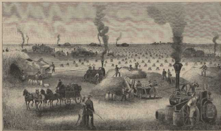
c. Ernte auf einer Riesefarm in Manitoba. G. B. III, 128. Vgl. S. 50b.