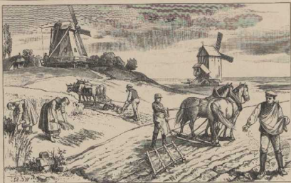
a. Feldbestellen und Flachsente in der Mark Brandenburg. G. B. III, 55.