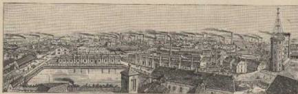
b. Das Krupp'sche Werk in Essen.* Aus Pabst, Landeskunde der Rheinprovinz.