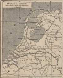
b. Das holländische Kanalnetz. Verkleinert aus Paulitschke, Geogr. Verkehrslehre.