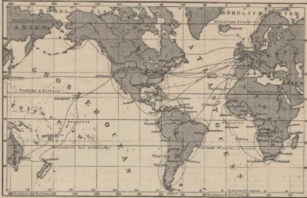
a. Europas Dampfschiffverbindungen mit dem Westen und Süden. Aus Paulitschke, Geogr. Verkehrslehre.