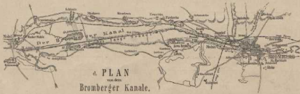
a. PLAN Bromberger Kanäle.