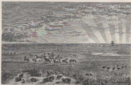
a. Ebene ohne Anbau: Aus den Pampas Südamerikas.