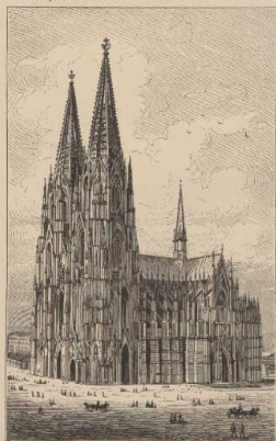
c. Quaderbau in gotischem Stile: Der Dom zu Köln.