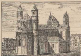
a. Quaderbau in romanischem Stile: Der Dom zu Worms.