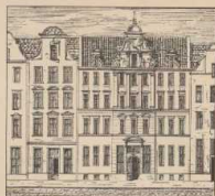
d. Städtische Häuser des 17. und 18. Jahrhunderts: Düncker's Häuser.