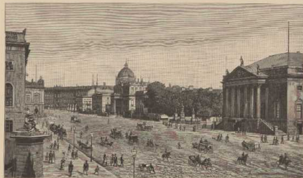
f. Straßensicht aus einer modernen Großstadt: Platz am Opernhaus in Berlin.