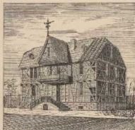
e. Fachwerkhäuser aus Süddeutschland. (Im Inn begriffen.)