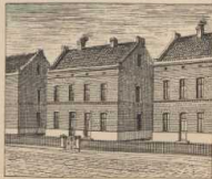
g. Arbeiterhäuser aus dem Elsass.