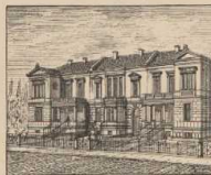
g. Moderne Cottage-Häuser aus Bremen.