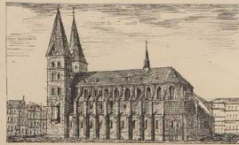
c. Backsteinbau in gotischem Stile: Die Marienkirche zu Lübeck.