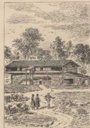
f. Alton Haus südlich von Falun.