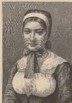
a. Mädchen von Anger (Dänem.)