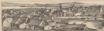
d. Reykjavik, von Norðstern gesehen.