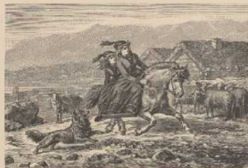
b. Reiternde Isländerin.