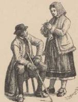
h. Winterode in Mos (Dobkacien).