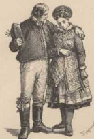
f. Leute aus Järstads (Schw.).