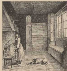
k. Hausanlage in Elfvik (an Sjöen See).