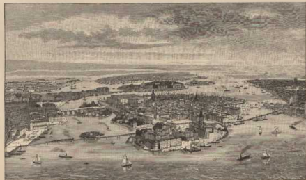
i. Stockholm (von Westen gesehen).