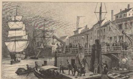
d. An Haften von Dublin.