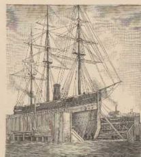
c. Schwimmendes Dock.