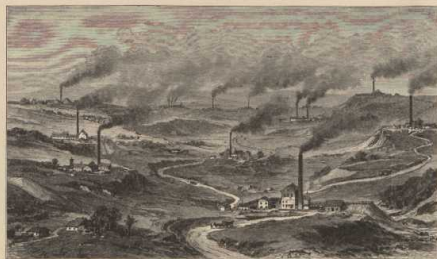
f. Aus dem englischen Bergwerksdistrikt.