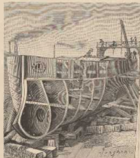
b. Klammes Schiff im Bau.